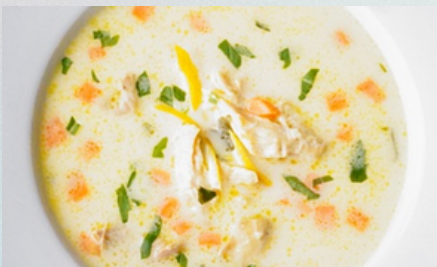
Ciorbă de pui A La Grec